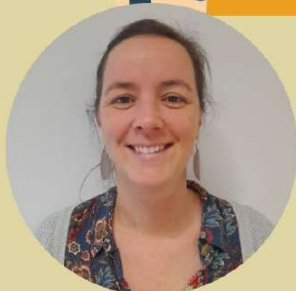
C'est elle !